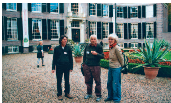
Symposium in Kasteel Groeneveld, 18 oktober 2007

Het cadeau van het ministerie van LNV ter gelegenheid van de uitreiking van de Heimans en Thijsseprijs - een dagje Kasteel Groeneveld met alles er op en er aan - pakte bijzonder goed uit. Veel belangstelling, zeer goede sfeer, levendige uitwisseling, prima verzorging door de medewerkers van het Kasteel en de catering.