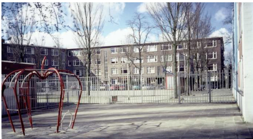
Kleuterplein voor de veranderingen

Achter het schoolgebouw, omgeven door hekken en de achtertuinen van de buurhuizen bevindt zich het kleuterplein van de school met een grote van ongeveer 750m 2 .