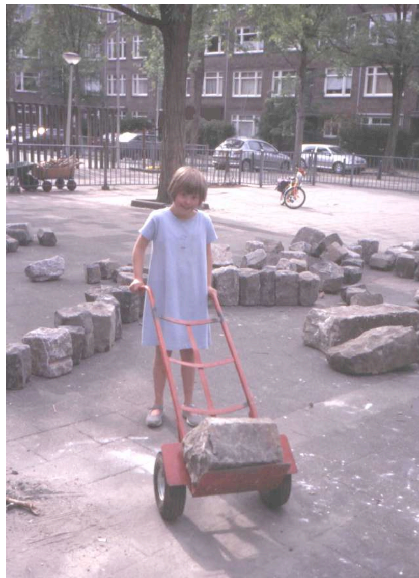
Liselot en de grote kei