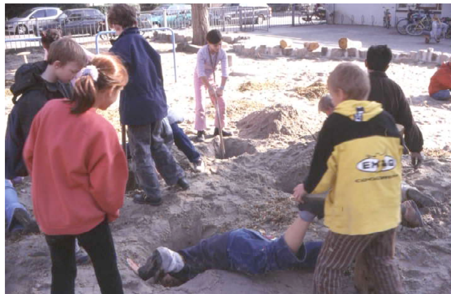
Kinderen graven gaten in het zand voor de larixpalen van de 'Evenwichts- en springstammen'