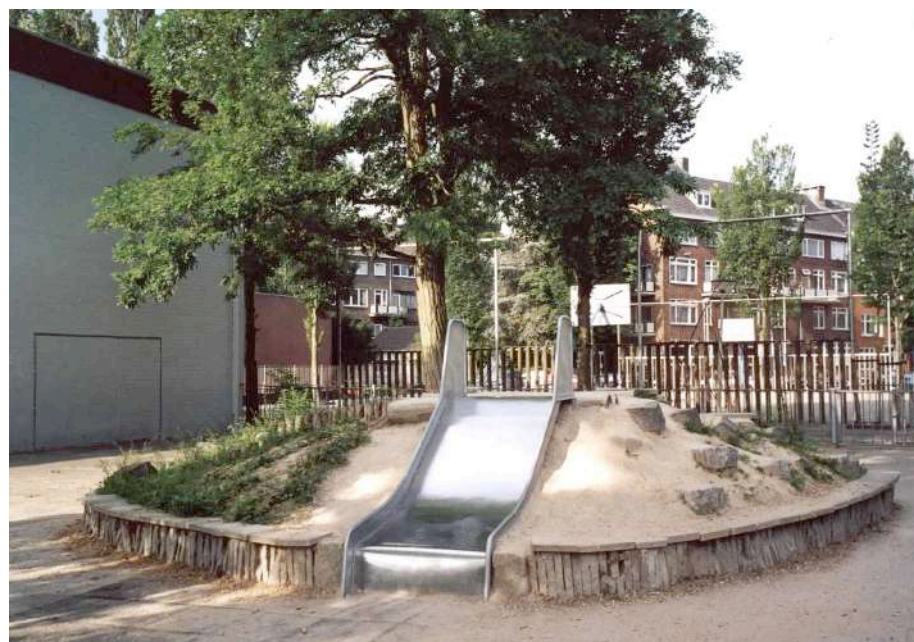
Glijbaanheuvel in de zomervakantie 2003

Het zal onze kinderen èn onze stad goed doen.