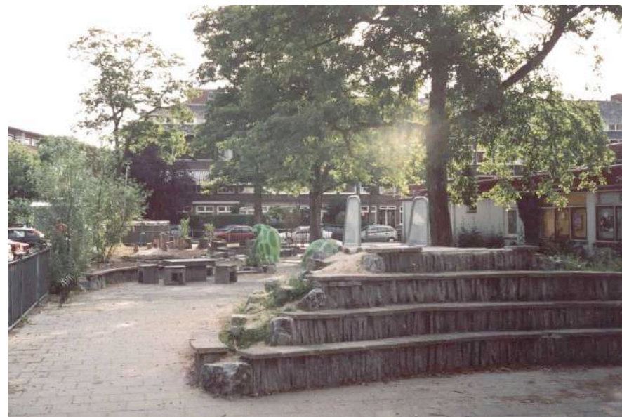
Het schoolplein in de zomervakantie 2003

Eind van het jaar konden de grote werkzaamheden afgerond worden en werd het schoolplein en het beheer daarvan overgedragen aan de school