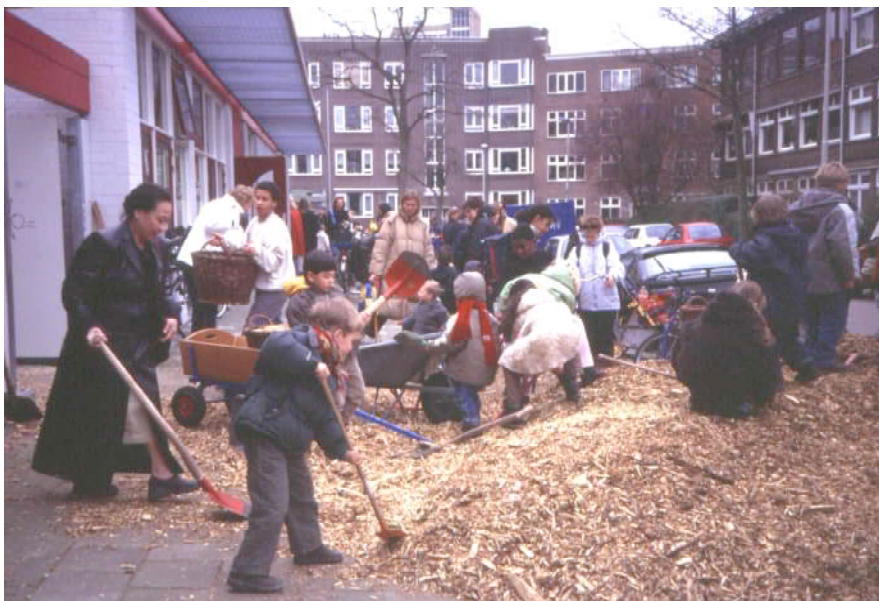
Houtsnipperactie na schooltijd

Van oude pallets is een toneelpodium tussen de bomen getimmerd. Een nieuwe speelheuvel, een stapelmuur van oude pleintegels, een pergola voor een druivendak, een takkenwal met knotwilgen langs het buitenhek en kleine tuintjes in houten kisten op het plein vormden de andere aanpassingen.