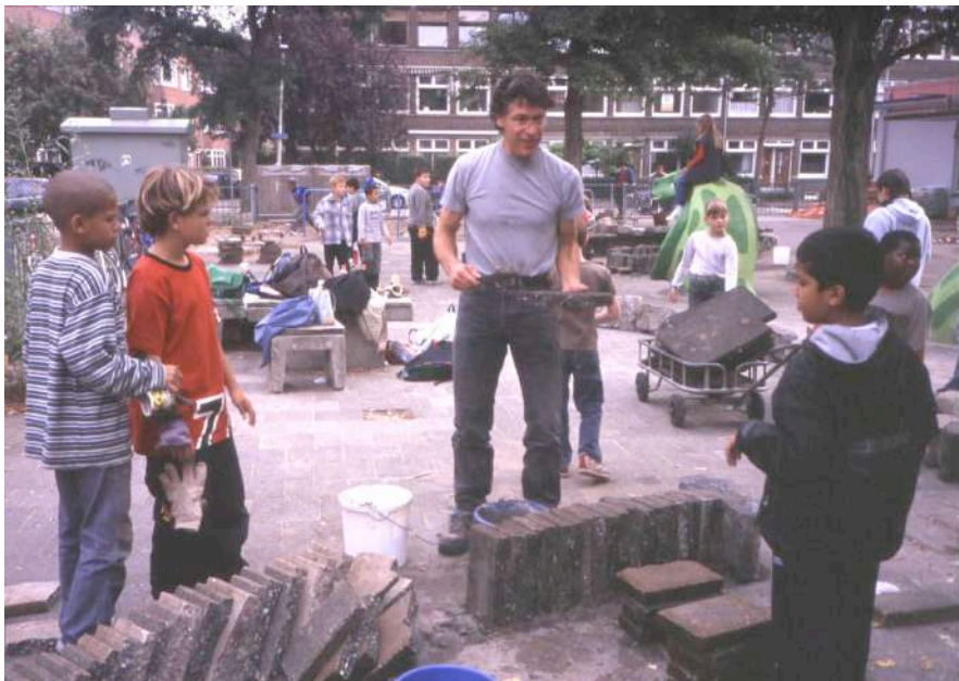
Een vader geeft metselles aan de kinderen

Op een aantal werkdagen in de lente van 2002 realiseerden scholieren, leerkrachten en ouders de eerste onderdelen van het nieuwe plein: enkele knotwilgen, een wilgenhut, een zitbank en een regenwateropslag van stoeptegels en oude havenkeien.