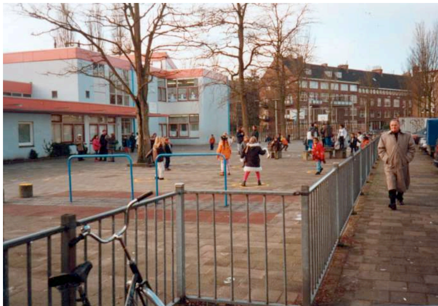
Schoolplein Daltonschool De Margriet , Rotterdam-Blijdorp 2001

“Schoolpleinen zijn vaak lege, ongestructureerde vlaktes, die aan de leerlingen geen houvast en oriëntatie bieden. Ze worden anoniem in de massa. Opvallen in deze massa, voor zichzelf en anderen een eigen, unieke persoonlijkheid ontplooiën, is voor veel scholieren alleen mogelijk door te schreeuwen (harder dan de anderen), wild te doen (wilder dan de anderen), te schoppen en te slaan (ruiger dan de anderen). Alleen wie de anderen overvleugelt of zelfs overheerst trekt de aandacht. Er ontstaat een klimaat van agressie en geweld...”