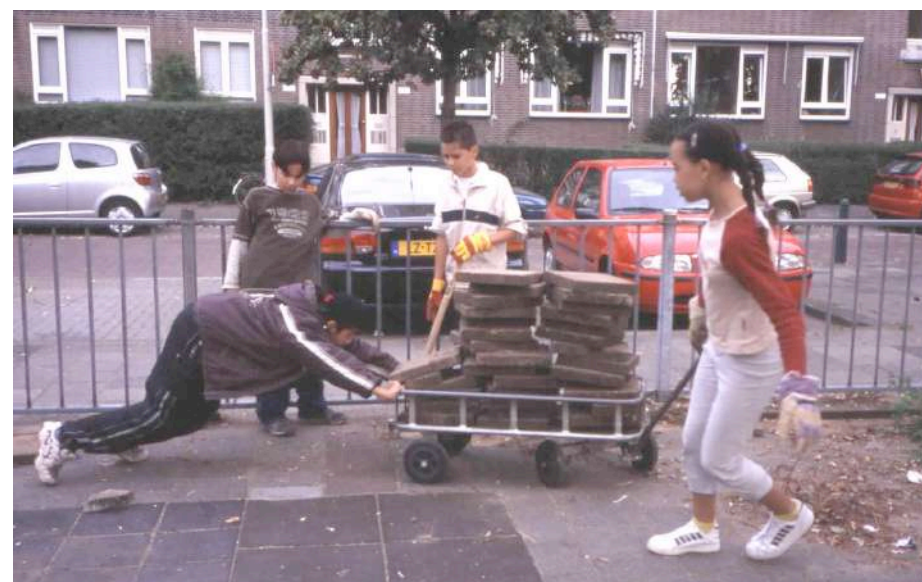
Met volle kracht en enthousiasme gaan kinderen aan de slag om de tegels op te ruimen

Het opbouwwerk zou bij dit soort vraagstukken een initiërende en verbindende rol moeten spelen. Het opbouwwerk is in staat bovengenoemde partijen bij elkaar te brengen en een dialoog te organiseren, waarbij alle aspecten van het thema schoolplein belicht worden. Hij/ zij functioneert hier als het ware als sociaal projectontwikkelaar, waarbij het belang van de buurt, namelijk kwaliteit van de openbare ruimte voorop staat.