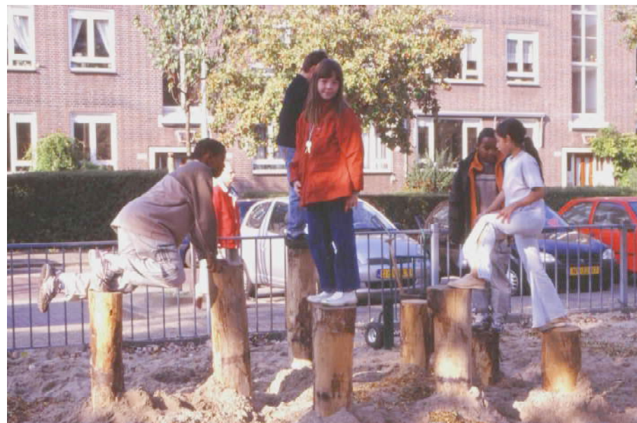
Zelfgemaakte speelaanleiding: Oprecht ingegraven Larixstammen

Conclusie, zeker voor mijn jongste: Hij heeft dankzij o.a. het schoolplein geleerd om zijn eigen impulsen beter te beheersen bij b.v. het op de basalt blokken lopen.