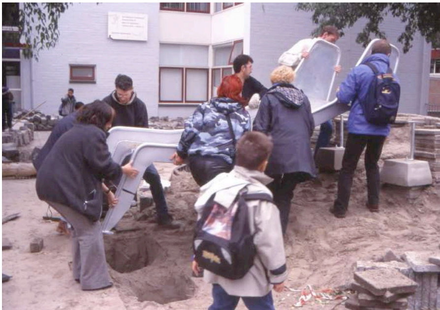
Het plaatsen van de glijbaan door ouders

Ik heb veel (heel veel) tijd en energie gestoken in het schoolplein. Wat ik ervoor terug gekregen heb is een stuk ervaring over hoe het ook “anders” kan, gezelligheid en waardering van mijn eigen kinderen. Ook het zien van spelende kinderen in plaats van alleen maar rennende kinderen is waarvoor je het uiteindelijk deed.