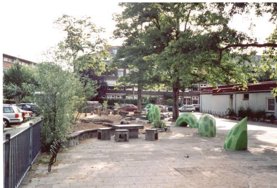
Groen en levendig schoolplein Daltonschool De Margriet, zomer 2003

De scholen moeten hierin financieel en personeel ondersteund worden.