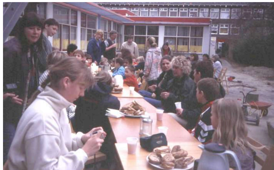
Lunchtijd op een tuinwerkdag

Daar hebben we nog geen goede vorm voor gevonden.