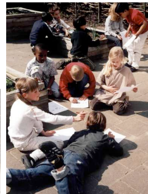
Pompoenenland op het kleuterplein