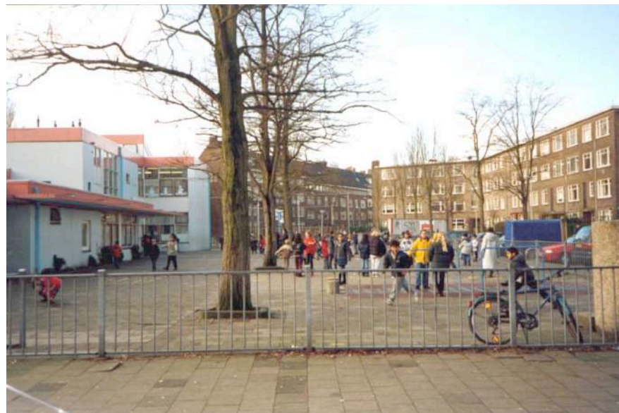
Voorplein, Situatie voor de vebouwing

De kinderen van de midden- en de bovenbouw maken tijdens hun pauzes gebruik van het grote, openbaar toegankelijke plein voor de school.