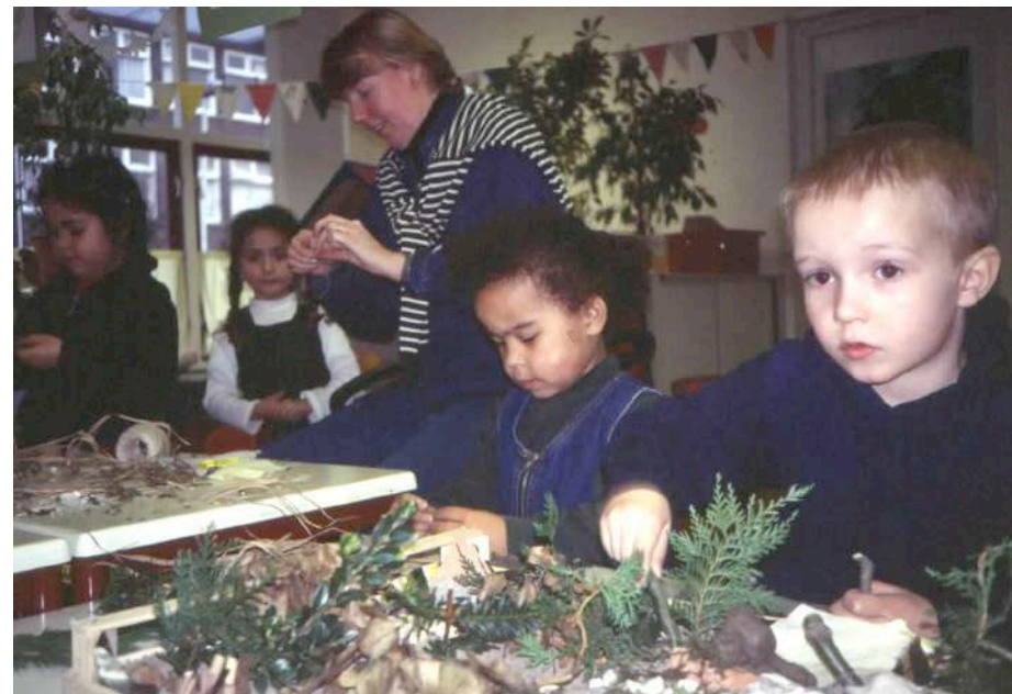
De kleuters bouwen hun Droomschoolplein in het klein

Na een inspirerende diashow over natuurlijke speelobjecten maakten de kleuters tuinmaquettes.