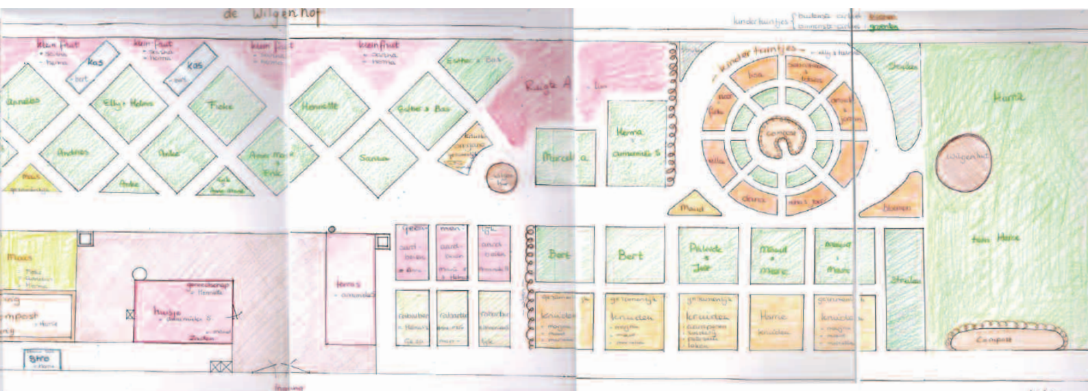
Plattegrond van de tuin zo als hij nu is