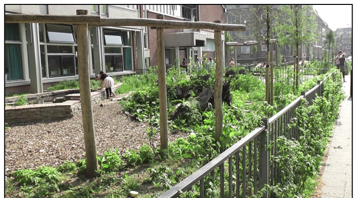
Afbeelding 2: Schoolplein Hildegardisschool na groene inrichting

Er is al veel kennis en kunde over de groene (her)inrichting van schoolpleinen en nieuwe kennis is in ontwikkeling. Maak gebruik van deze bestaande kennis en leer van ervaringen uit het verleden. Wees daarbij vooral ook open over missers en fouten. Verzamel do's en dont's en zorg voor meer uitwisseling tussen scholen onderling en tussen andere betrokken partijen.