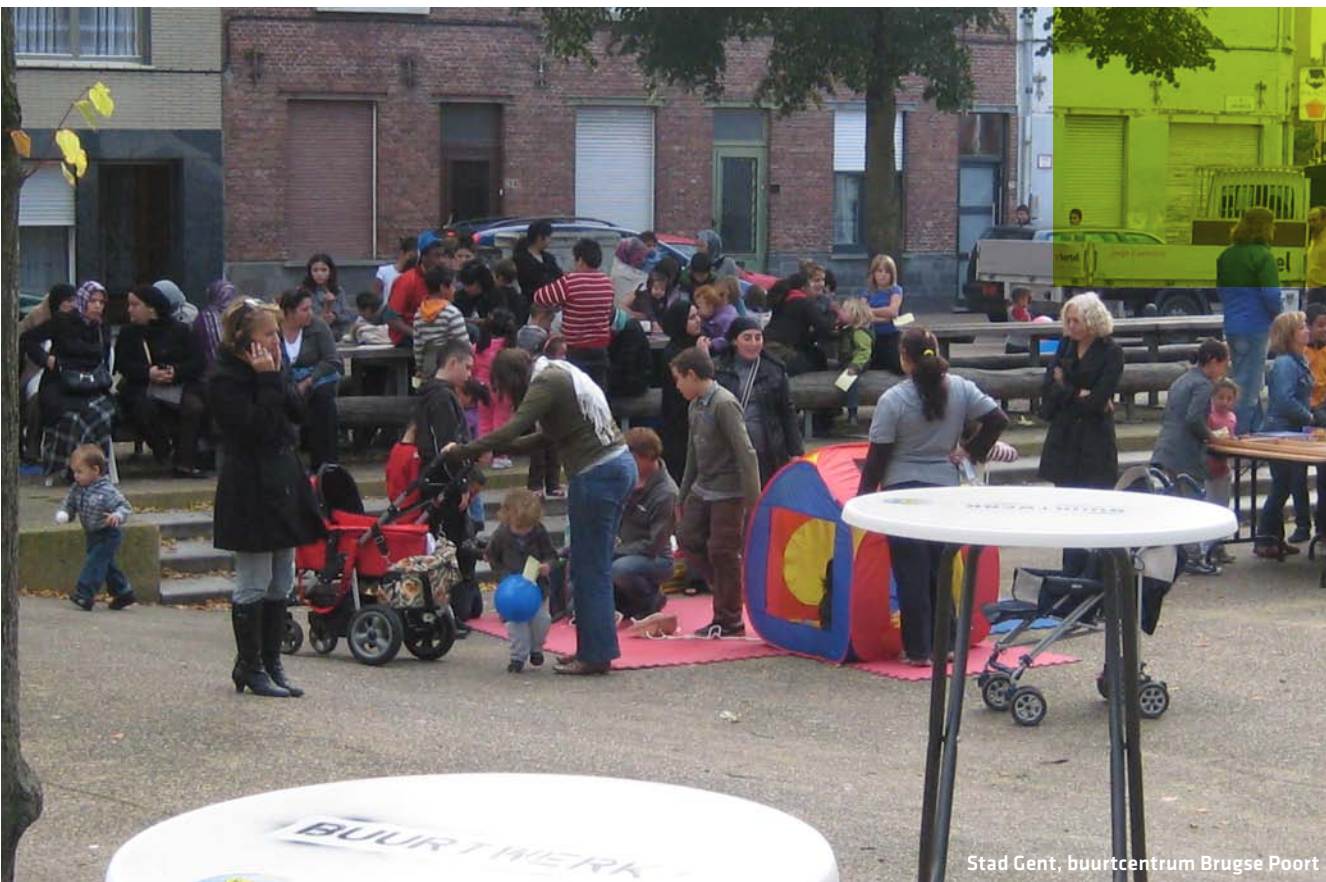
Stad Gent, buurtcentrum Brugse Poort