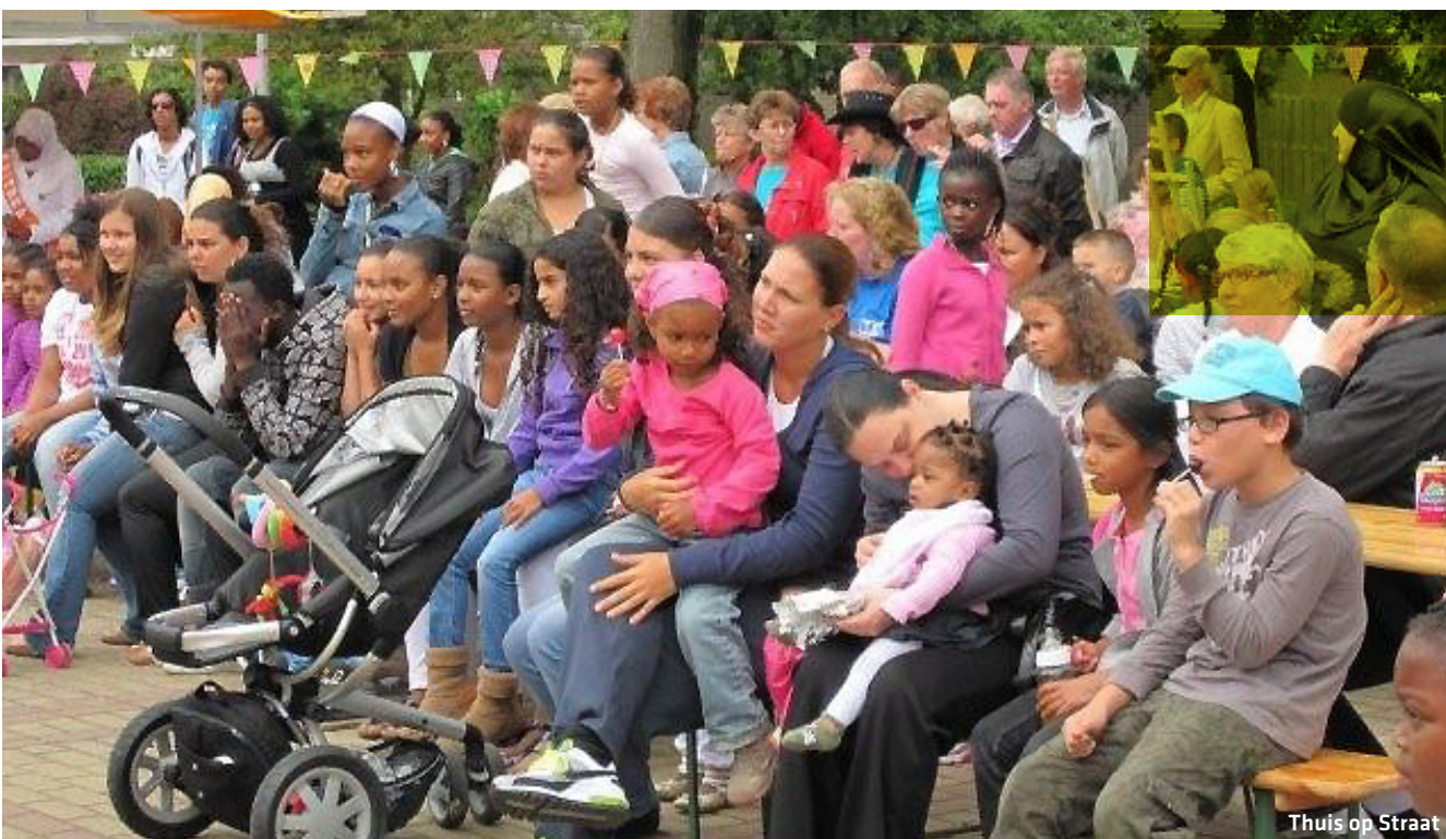
Thuis op Straat