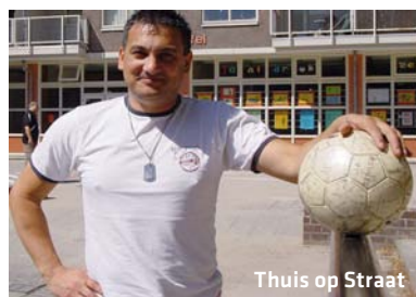
Thuis op Straat