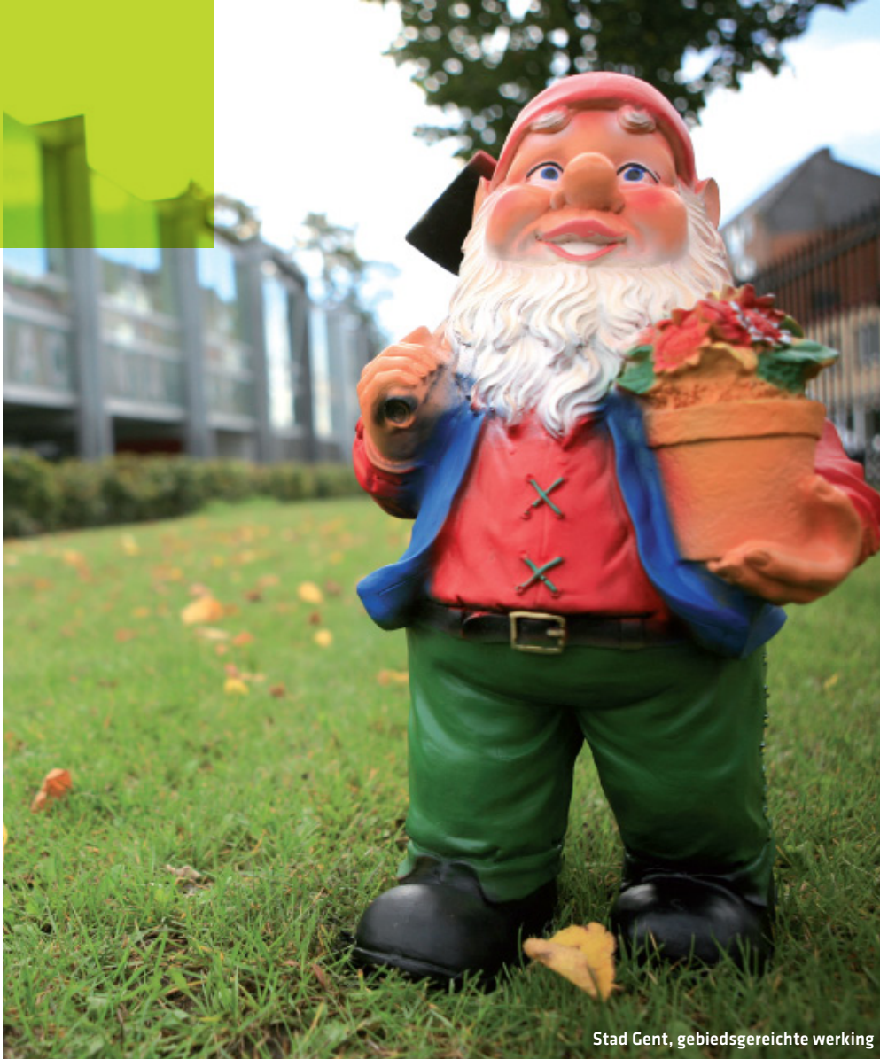
Stad Gent, gebiedsgereichte werking