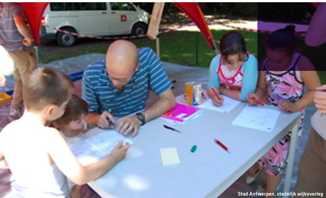
Stad Antwerpen, stedelijk wijkoverleg