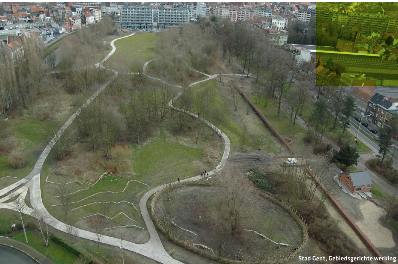
Stad Gent, Gebiedsgerichte werking