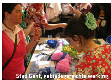
Stad Gent, gebiedsgereichte werking