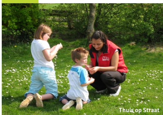
Thuis op Straat