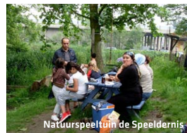
Natuurspeeltuin de Speeldernis