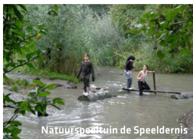
Natuurspeeltuin de Speeldernis