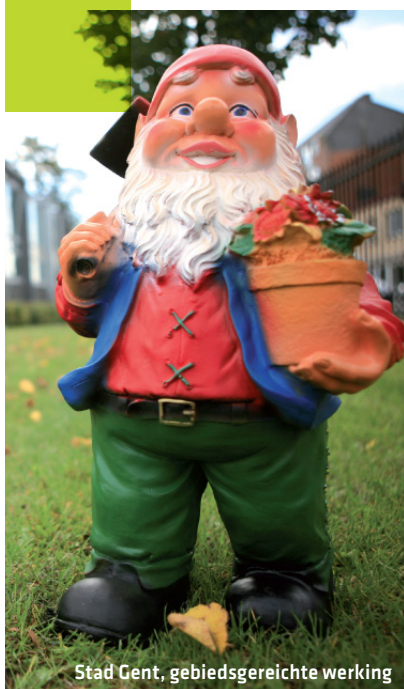
Stad Gent, gebiedsgereichte werking