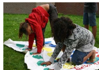
Thuis op Straat