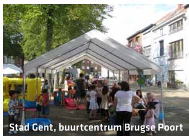
Stad Gent, buurtcentrum Brugse Poort