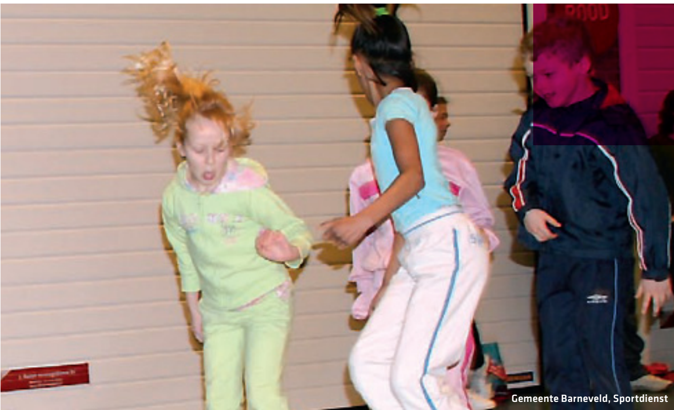
Gemeente Barneveld, Sportdienst