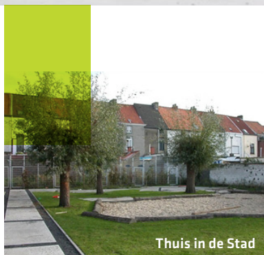
Tuis in de Stad