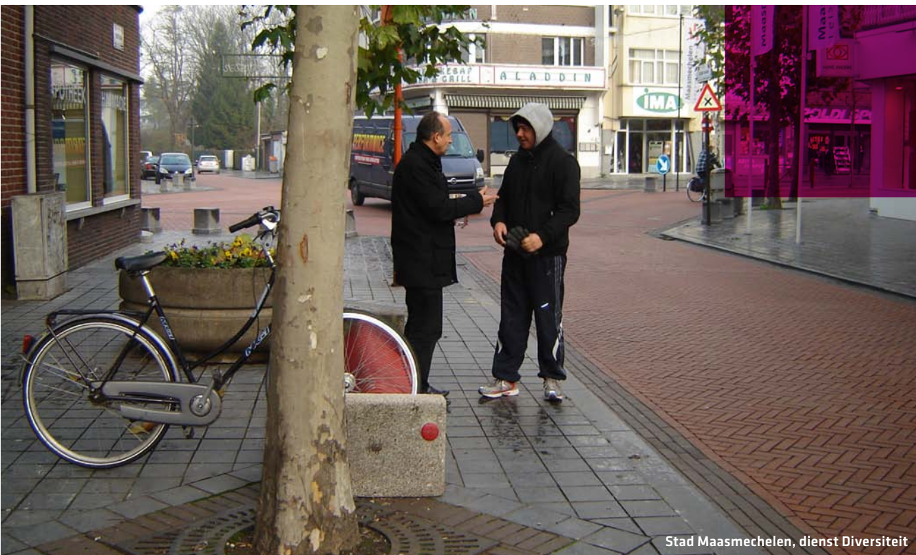
Stad Maasmechelen, dienst Diversiteit