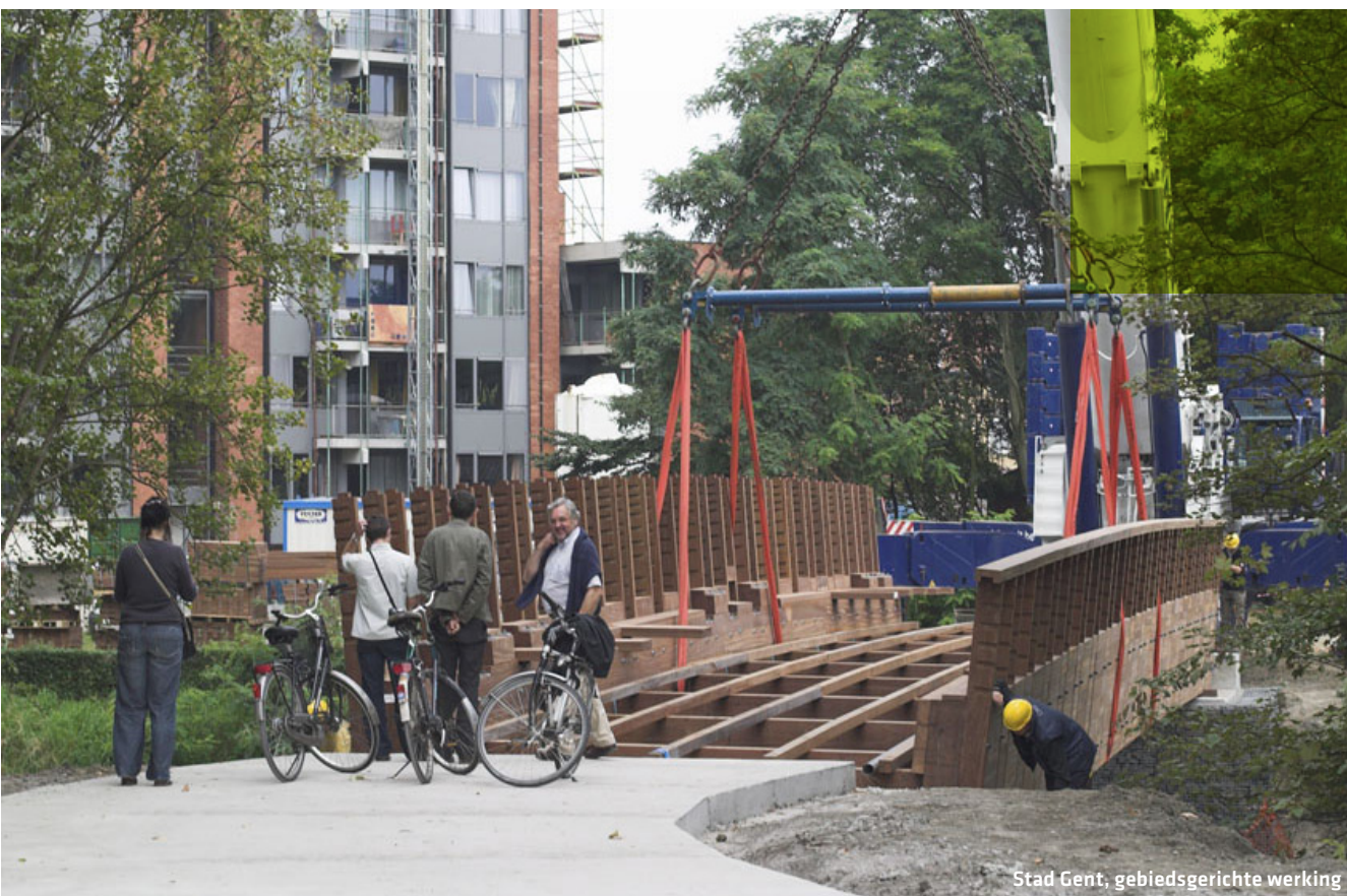
Stad Gent, gebiedsgerichte werking