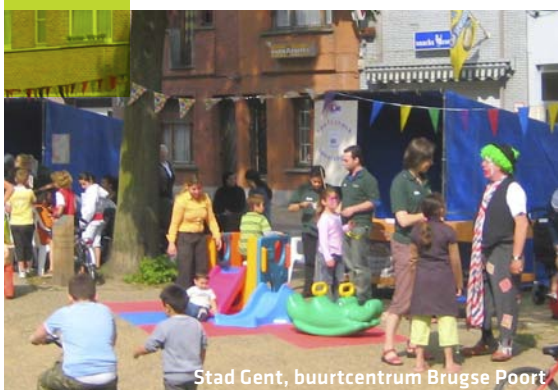
Stad Gent, buurtcentrum Brugse Poort