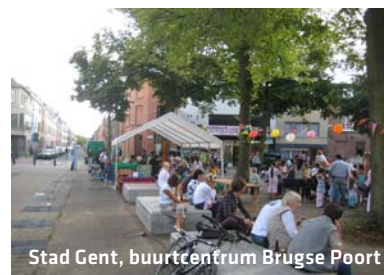
Stad Gent, buurtcentrum Brugse Poort