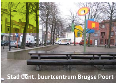
Stad Gent, buurtcentrum Brugse Poort