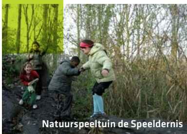
Natuurspeeltuin de Speeldernis