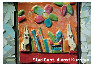
Stad Gent, dienst Kunsten