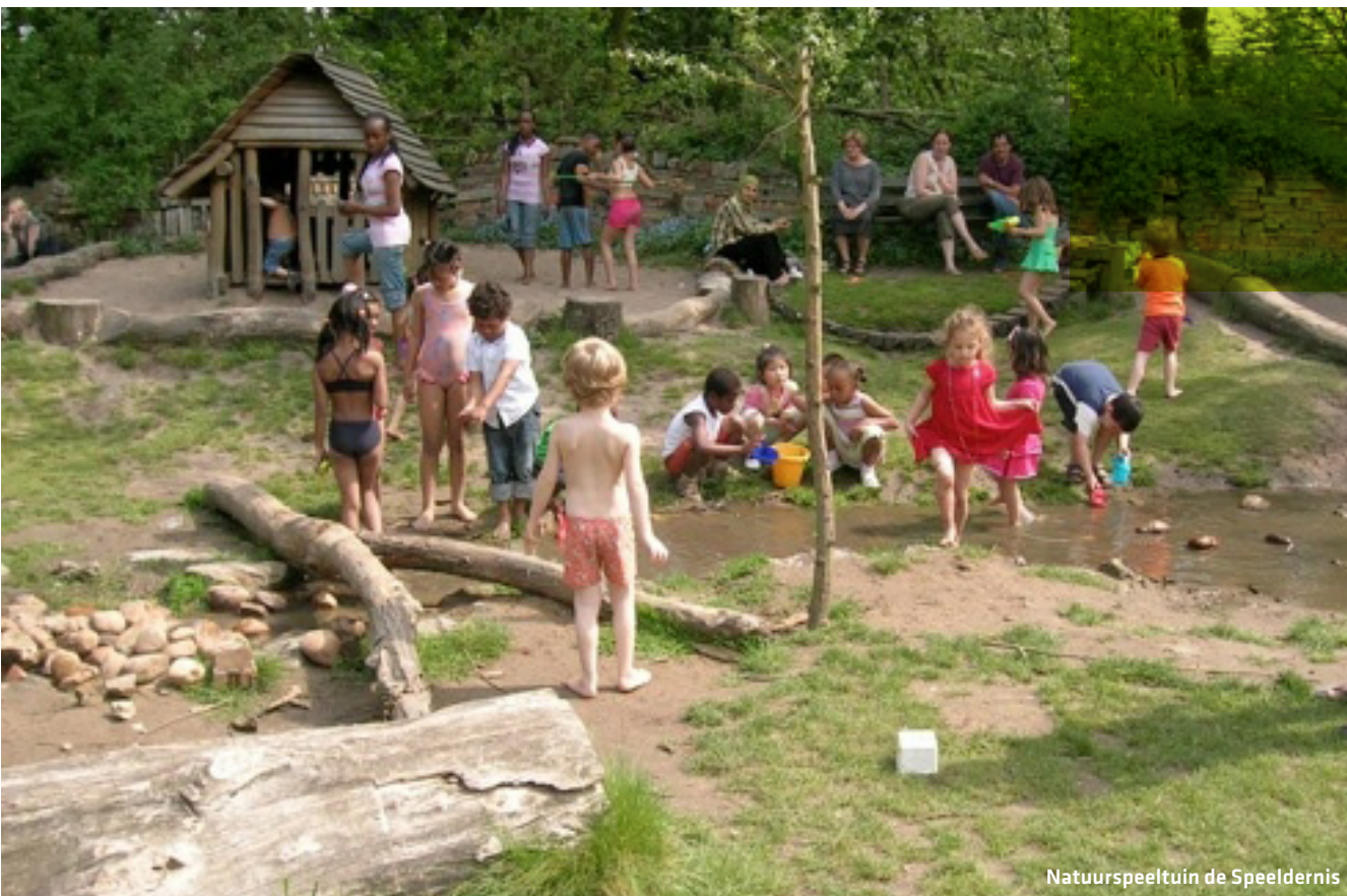
Natuurspeeltuin de Speeldernis