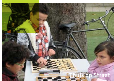
Thuis op Straat