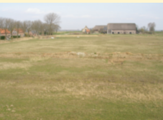
De plek ligt te wachten op wat komen gaat, maart 2011.

De volledige tekst is te vinden op: http://www.natuurmonumenten.nl/content/sigrun-lobst-ontwerpster-van-het-natuurspeelterrein-op-tiengemeten?page=2