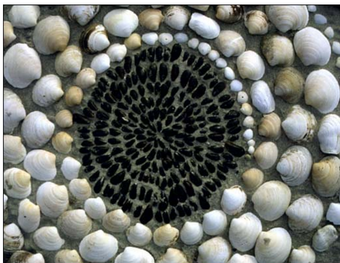
Natuurkunst aan het strand