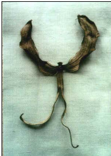
Gepelde banaan, kunstwerk van Magnus Lönn

Een tweede voorbeeld van kunstgebaseerde natuureducatie in de Noordelijke landen is de tentoonstelling 'Woorden in de taal van takken' ( Palaver på grenesiska ). Deze expositie over 'de taal in de natuur en de natuur in taal' van de kunstenaars Magnus Lönn en Björn Ed toerde een aantal jaren door Zweden. Hierbij werden steeds de plaatselijke scholen uitgenodigd om te komen kijken en deelnemen. Lönn en Ed zijn erop uit om associaties te zoeken tussen natuurbeelden en taalexpressies.